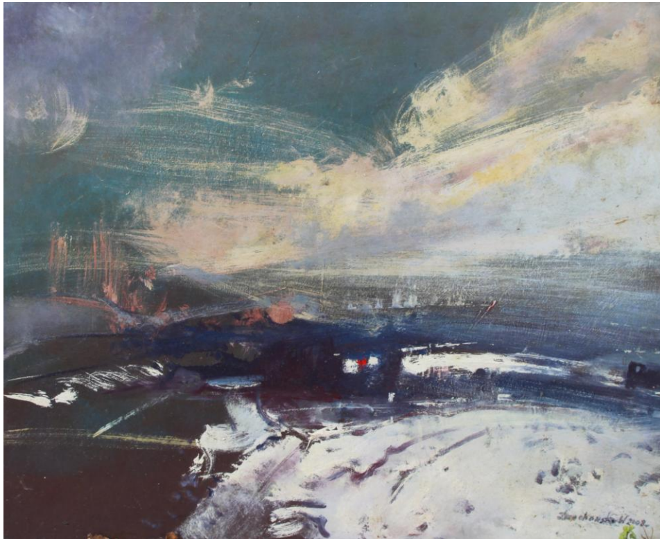
Pejzaż, 2007 – olej / płyta (50 x 60 cm)