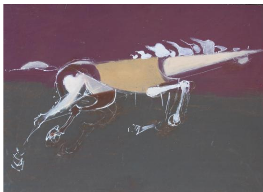
Korń, 2013 – olej / płyta (50 x 70 cm)