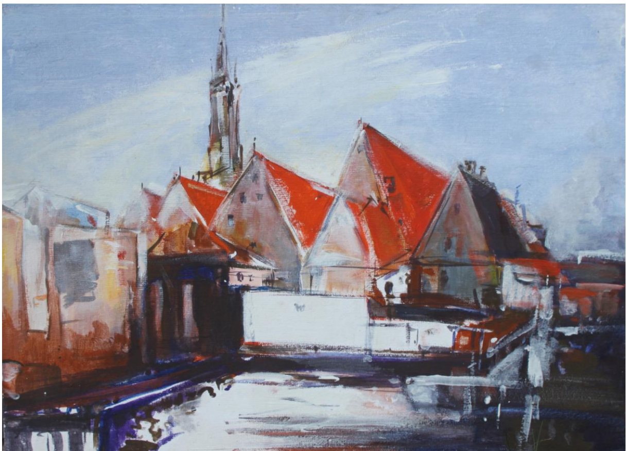
Brugia, 1997 – olej / płyta (50 x 70 cm)