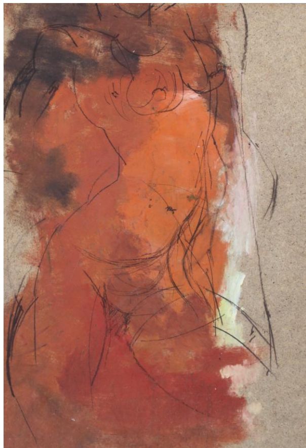
Akt, 2014 – olej / płyta (50 x 35 cm)