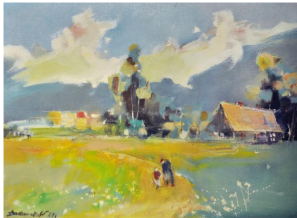
Pejzaż, 2007 – olej / płótno (30 x 40 cm)