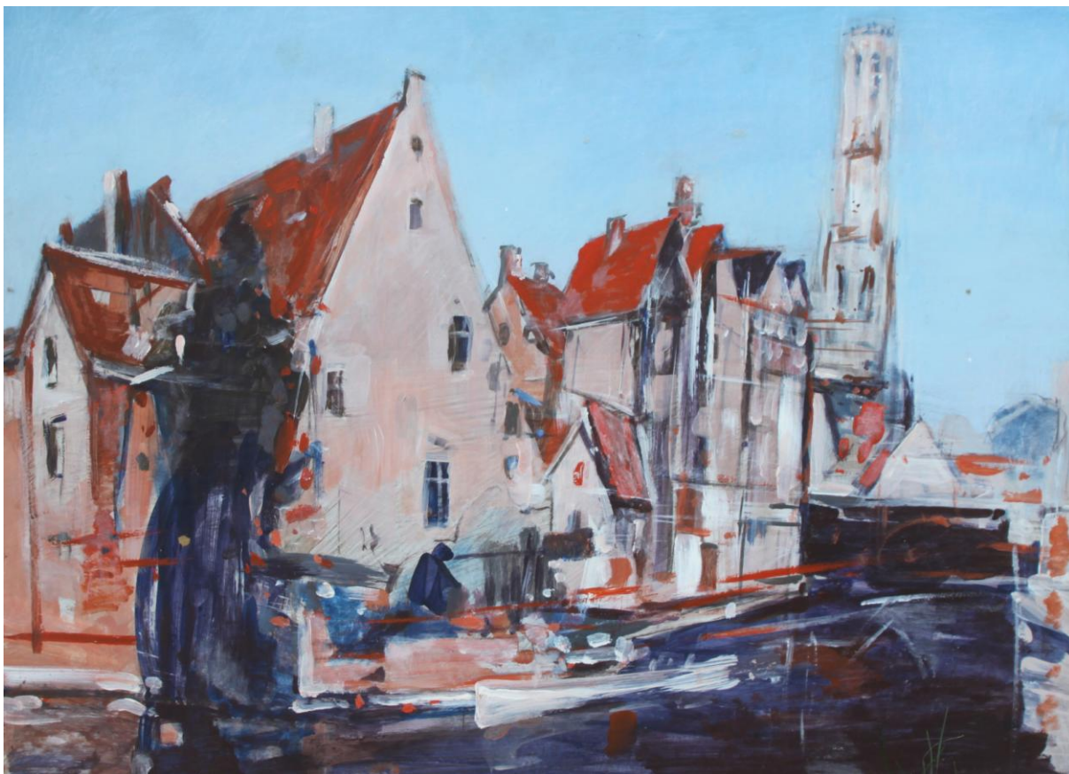
Brugia, 1997 – olej / płyta (50 x 70 cm)