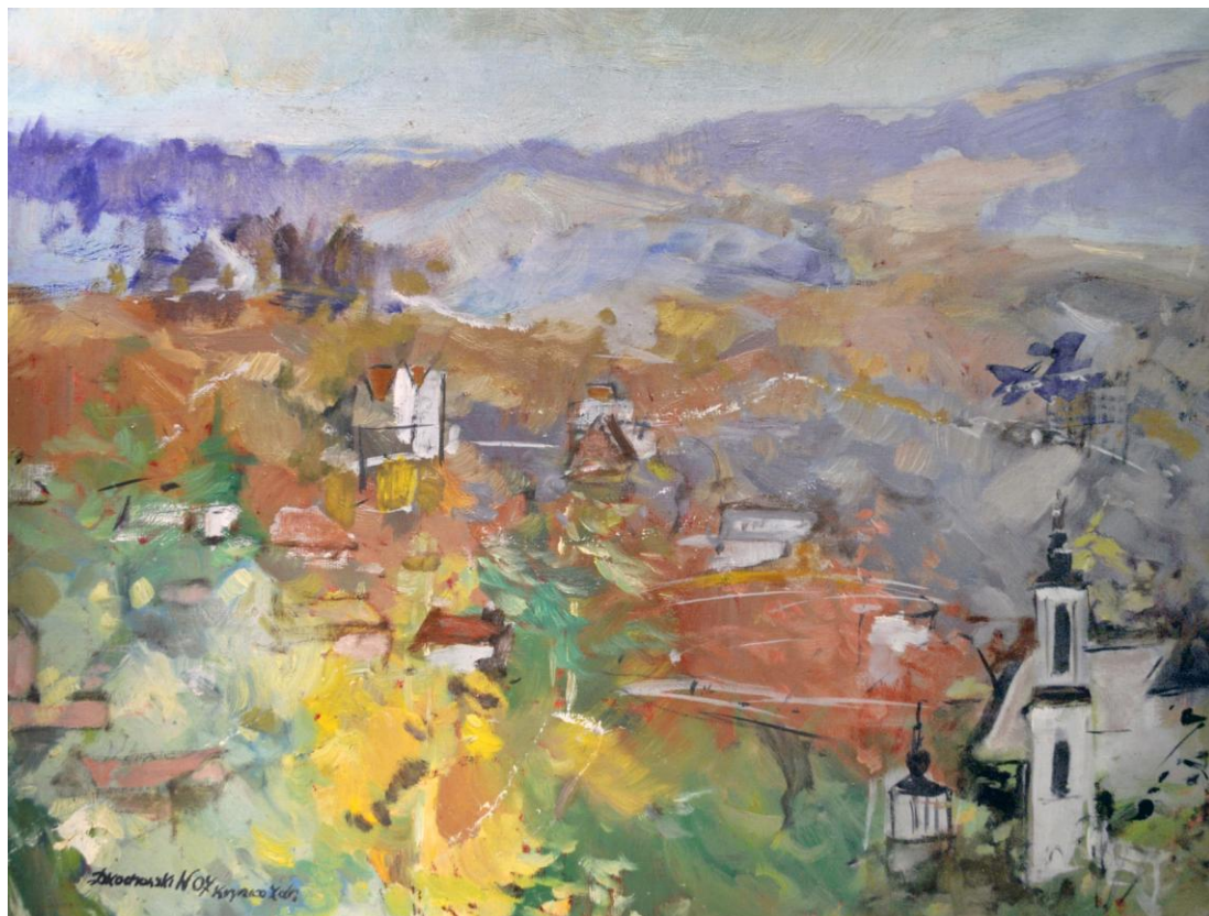
Krynica, 2007 – olej / płyta (46 x 61 cm)