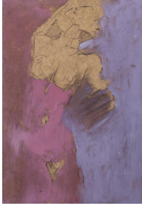
Akt, 2014 - olej / płyta (50 x 35 cm)