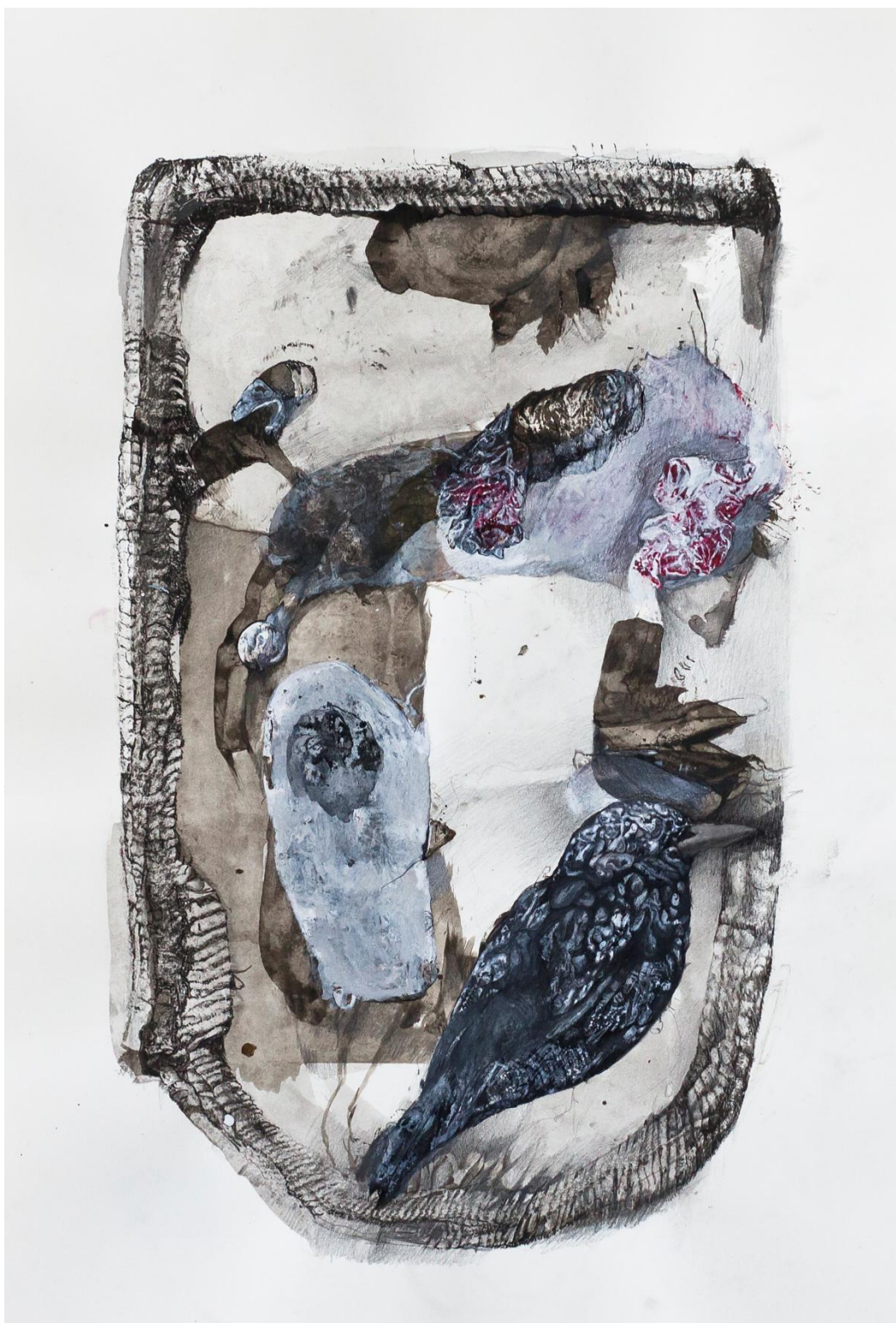
Re – konstrukcje: Dzicy Lokatorzy 3, 2012 - rysunek tuszem (57 x 39 cm)

Laureatka VI International Biennial of Drawing, 2008 - Pilsen / Niemcy, nagrodzona certyfikatem "Certificate of the Highest Quality". Zajmuje się rysunkiem i malarstwem.