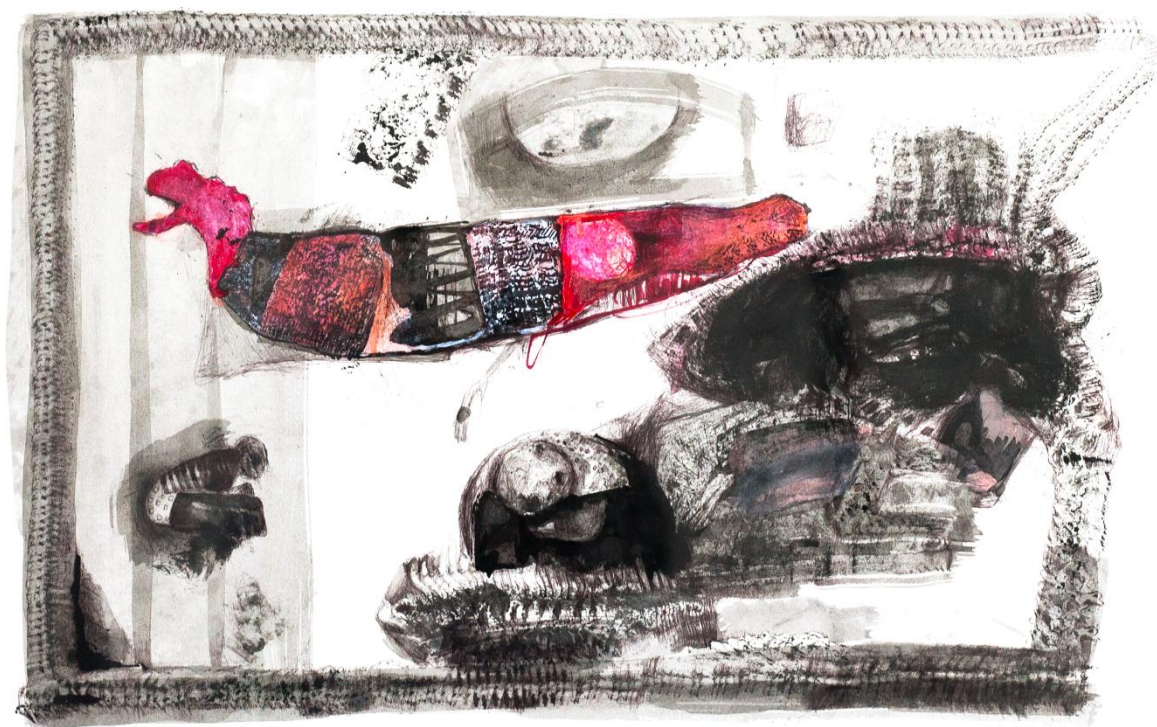
Re – konstrukcje: Salto, 2007 - rysunek tuszem (70 x 100 cm)

Sztuka nie musi wyrażać natrętnych idei, tendencji społecznych lub politycznych. Powinna jednak zwracać uwagę na napięcia powstające na styku człowiek - rzeczywistość. Takie wrażenie odnoszę śledząc trasę szlachetnej materii, płaszczyznę papieru pokrytą kompozycją rytmów i form, których gra wciąga moją uwagę w głąb istoty sensu jej pracy. Odkrywczy aspekt jej wizji nie polega na ilustracyjnej narracji łatwej do połknięcia lecz na intuicyjnym wyczuciu w którym oko, myśl i ręka współpracują harmonijnie ukazując spójność wartości ducha i materii w symbiozie z kunsztem artystycznym. Rozwiązanie przestrzeni, gradacja walorowych kontrastów, dyskretna dramaturgia, to środki wyrazu które prowadzą widza w głąb osobistej refleksji i porównań, gdyż sztuka Szczepanowskiej jest sugestywna i przekonująca. Czuje się siłę i potencjał rozwojowy. Jest godna zaangażowanego zainteresowania.