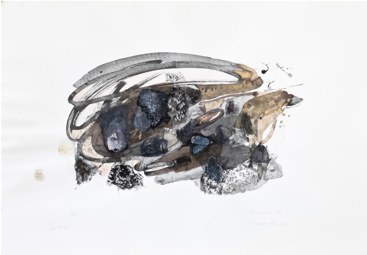
Re – konstrukcje: Widok z Okna, 2007 - rysunek tuszem (70 x 100 cm)

Wystawy: 2014 - Re-Konstrukcje, wystawa indywidualna, Muzeum Narodowe w Krakowie 2011 - Wystawa grafik w Galerii Sztuki Katarzyny Napiórkowskiej; 2010 - Razem i Osobno, Instytut Polski w Sofii / Bułgaria; Niewysłane Listy - wystawa poświęcona Fryderykowi Chopinowi, Galeria Brama w Zamościu; Nullus Dies Sine Linea, Muzeum Plakatu w Wilanowie, Teatr Rampa w Warszawie - cykl wystaw poświęconych pamięci prof. F. Starowieyskiego; 2009 - wystawa pokonkursowa II Ogólnopolskiego Triennale "Granice Rysunku" w Galerii PWST, ASP w Krakowie; Wystawa pokonkursowa w Galerii Miejskiej w Rzeszowie; The Best Collection The Biennial of Drawing, Centre Bavaria Bohemia Pilsen / Niemcy; 2008 - wystawa pokonkursowa, Museum of West Bohemia in Pilsen / Niemcy; 2007 - I Zamojskie Biennale Sztuki do poezji Bolesława Leśmiana "Malinowy Chruśniak"; Warsztaty Graficzne w Kasterlee / Belgia; 2006 - Teraz MY, wystawa zbiorowa, Galeria Tamka w Warszawie; Cytadela Grafiki, Galeria Ateneum Młodych w Warszawie; 2005 - wystawa "Parada Zwierząt" w Galerii Art Novum w Warszawie.